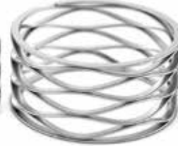
Crest-to-Crest® Wellenfeder mit parallelen Enden