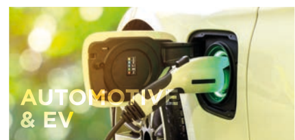
AUTOMOTIVE & EV