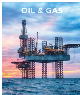
OIL &amp; GAS