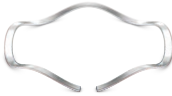
MEHRFACHWELLEN (SIEHE TABELLE)

Einlagige Flachdraht-Wellenfeder mit verringerter Drahtbreite